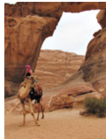
Halte près de la «petite arche» haute tout de même d'une vingtaine de mètres

découvrirons les étonnantes inscriptions nabatéennes rupestres de Khazali, gorge encaissée située près de Rum, village qui a donné son nom au désert qui l'entoure. ■