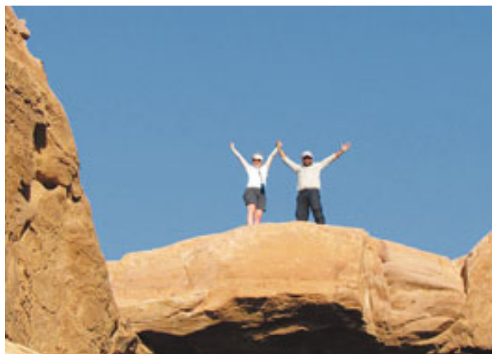
Le désert du Wadi Rum s'étend sur 700 km 2